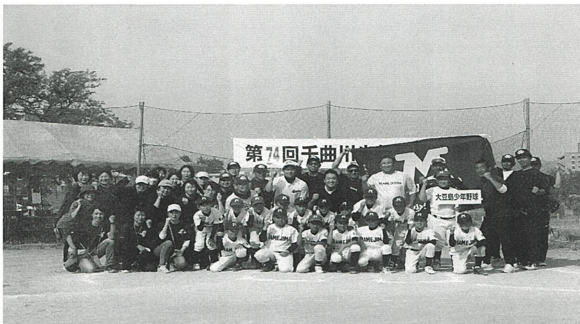
第74回千曲川少年野球大会 野球教室 (令和5年5月26日)